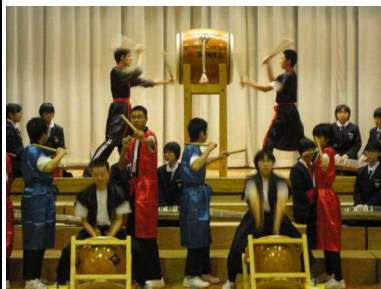
去年の文化祭での共演の様子

今日は終業式です。明日から8月23日まで33日間の夏休みとなります。1学期間の取組は、どうだったでしょうか。1学期は様々な行事がありました。3年生の修学旅行、1・2年校外学習、小中大運動会、中間テスト、虚空蔵山清掃、市中体夏季大会、期末テスト、第1回ドリルテスト、図書館利用などさまざまな教育活動がありました。それぞれの活動の中で、今の自分の力、集団の力はどのくらいあるのか、どのような力が付いたのか、どのような力を付けなければならないのか、など、振り返りを行いながら見つめ直しました。この夏休みは、目標をしっかりともち、学習会や部活動に汗を流し、規則正しい生活を行い、計画的に過ごしてほしいと思います。そのためには。